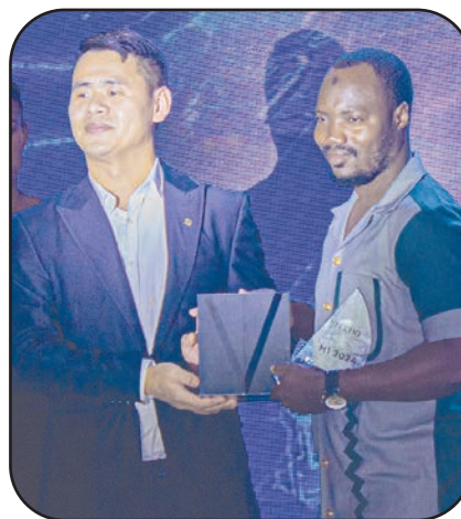
Le mérite des meilleurs vendeurs et revendeurs récompensé

L'écosystème et l'Intelligence artificielle (IA). Ce sont désormais les nouveaux challenges de l'entreprise Tecno. En effet, elle ambitionne de révolutionner la technologie d'ici à l'horizon 2025. Des perspectives qu'elle a présentées dans la nuit du 28 septembre 2024, marquant par la même occasion, ce grand envol grâce à l'IA avec ses produits qui s'annoncent plus intelligents, plus intuitifs et mieux adaptés aux besoins des populations. Selon le Directeur commercial de Tecno, l'entreprise ne se présente plus comme une marque de téléphone, mais une marque de haute technologie. Selon lui, Tecno dispose de quatre séries de téléphones qui sont : la Camon30 S, la Spark 30, le Phantom V Fold2 & Flip2, la MégaPad (tablette), sans oublier des ordinateurs, accessoires, etc. « Nous sommes dans le gaming, les jeux vidéo virtuels, sans oublier la technologie robotique. Nous nous