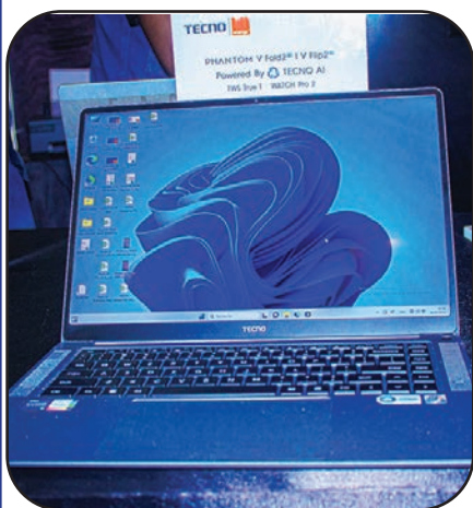
Des ordinateurs de dernière génération et...