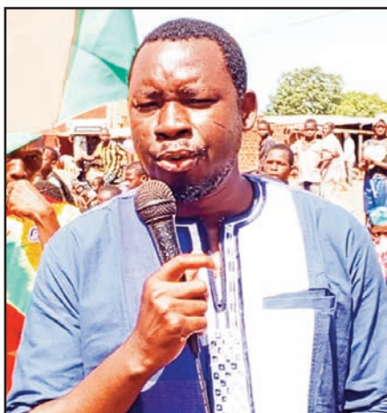
Le PDS a invité toutes les structures de soutien et de veille citoyenne à parler le même langage

Une marche-meeting pour réaffirmer le soutien au président du Faso, le capitaine Ibrahim Traoré. C'est ainsi que la Coalition régionale des Organisations de la société civile (OSC) de la Boucle du Mouhoun a commémoré l'an II du MPSR II, dans la matinée du 30 septembre 2024 à Dédougou. Pour l'occasion, des populations de toutes les couches, composées en majorité de jeunes, ont battu le pavé à travers les grandes artères de la cité de Bankuy. Munis de drapeaux, de pancartes et de vuvuzelas, à pieds, à vélos, à motos ou en tricycles, la horde de manifestants a marqué des haltes devant les services de sécurité pour encourager et magnifier les combattants. « Tenez bon ! Le bout du tunnel est pour bientôt. La patrie ou la mort, nous vaincrons ! », a lancé un manifestant, le poing fermé. Une vieille femme qui a rejoint les marcheurs a égrené des bénédictions à l'endroit des FDS et VDP. « Vous êtes tous bénis. Un enfant béni ne connaîtra jamais la honte. Dieu demeurera votre bouclier ! », a déclaré la sexagénaire en langue mooré sous une salve d'applaudissements. Sur leur trajet, les marcheurs ont affirmé leur soutien au capitaine Ibrahim Traoré et à ses pairs de l'AES. Mieux, ils ont exprimé des messages hostiles aux manipulateurs et