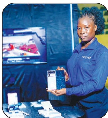
... le phantom V fold 2, ici présentés