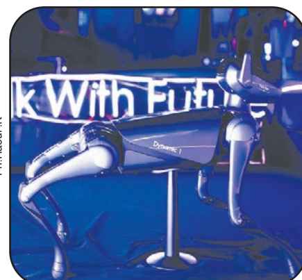
« Taguy » ou « le chien robot » bientôt en activité