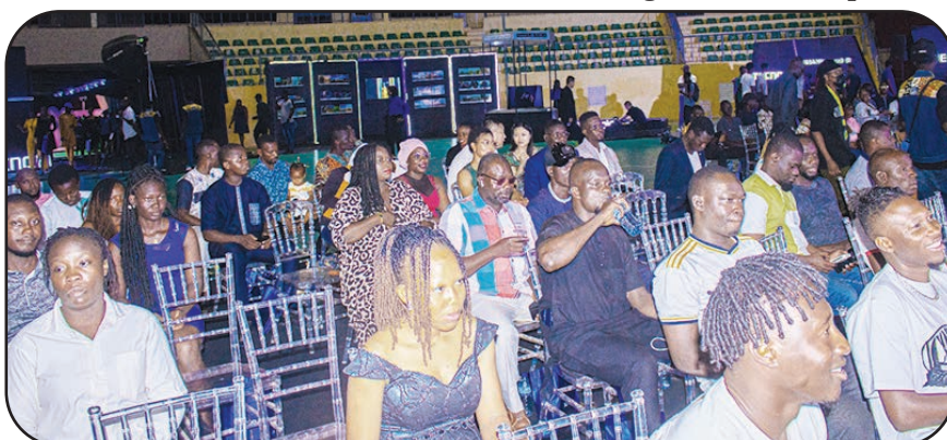
Ambassadeurs, partenaires et collaborateurs se sont mobilisés à l'occasion de ce grand jour