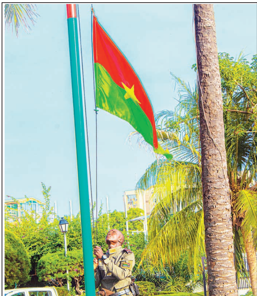
.... la montée des couleurs

A l'issue de la montée des couleurs, il a invité les agents de la mairie à procéder chaque dernier vendredi du mois, à la descente du drapeau □